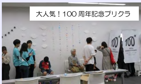
大人気！100周年記念プリクラ

明星学苑100周年記念で実施されたプリクラ、縁日やステージ、模擬店などを、たくさんの方々にお楽しみ頂きました。