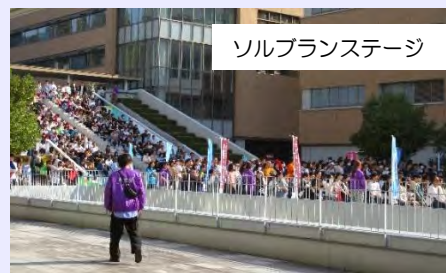
ソルブランステージ