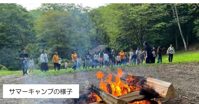
サマーキャンプの様子

「子ども＋学生という単位でテントに分かれて宿泊しました。自分を含め、キャンプ経験のある部員がいて、うまく運営することができたと思います。子どもたちが寝ないだろうと思ってたくさんレクリエーションをいれたら、夜はテントでも皆ぐっすり寝てくれてよかったです。(キャンプ場は)夏でも寒暖差があったので、熱中症や、寒くて風邪をひかないかなどを特に配慮しました。保護者の方々とも連携して、無事大きなイベントをこなすことができました。」